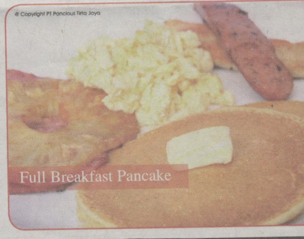
Full Breakfast Pancake