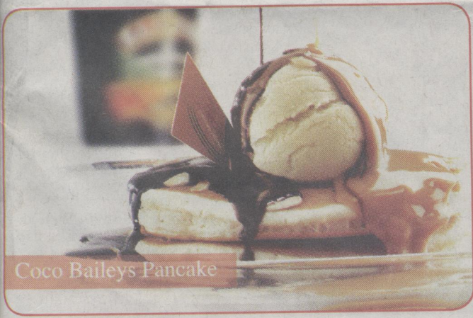
Coco Baileys Pancake

Bagi Anda yang h menikmati kelezatan Panca Pancious Pancake House, kunjungi restoran Pancious House di Jl. Permata Hijau No.12 Jakarta selatan, Pacific Mall Level 5 Unit 39 J Sudirman Kav. 52-53 Jakarta dan Plaza Indonesia Level E06-E08 J.L.M.H.Thamrin 30 Jakarta Pusat.