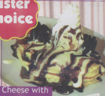
Oreo Cheese with cookies & crème

Jl. Permata Hijau Blok A No.12 Jakarta Selatan Telp.(021) 5304325 Opening hours: weekdays (11.00 – 23.00) weekend (08.00 – 23.00)