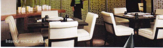
Interior restoran Aoki