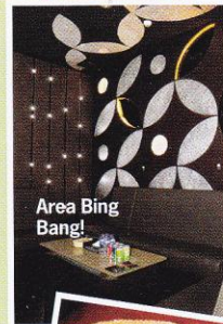
Area Bing Bang!

ALAMAT: JL. GATOT SUBROTO KAV. 16 RSVP. (021) 5267827