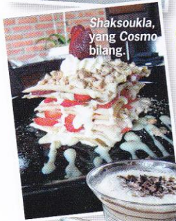
Shaksoukla, yang Cosmo bilang.