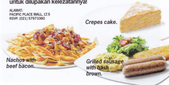
Nachos with beef bacon.

ALAMAT: PACIFIC PLACE MALL, LT.5 RSVP. (021) 57973360