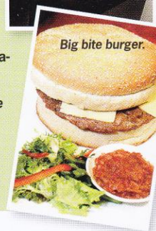
Big bite burger.