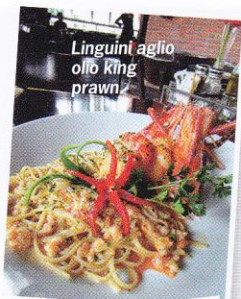
Linguini aglio olio king prawn.

Sulit diungkapkan mengapa kuliner khas Italia selalu meninggalkan kesan baik di lidah. Alasan ini yang membuat Cosmo memburu restoran Italia dan berakhir melandaskan kaki di Luna Negra, yang berarti "rembulan gelap" dalam bahasa Italia. Selain suguhan menu andalan Italia yang mutiak Anda pegang sebagai garansinya,