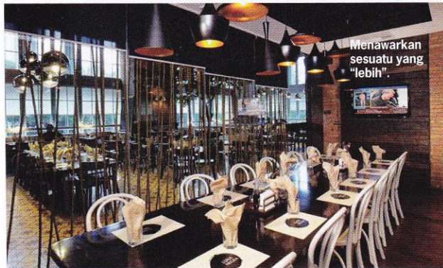
Menawarkan sesuatu yang "lebih".